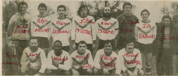
Le « onze » fanion