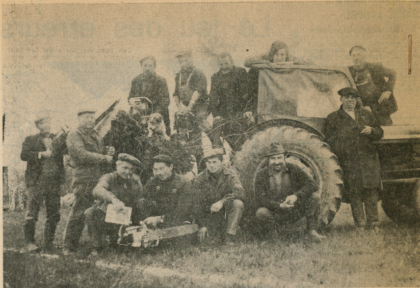
Une équipe de bénévoles pour assurer l'aménagement du stade