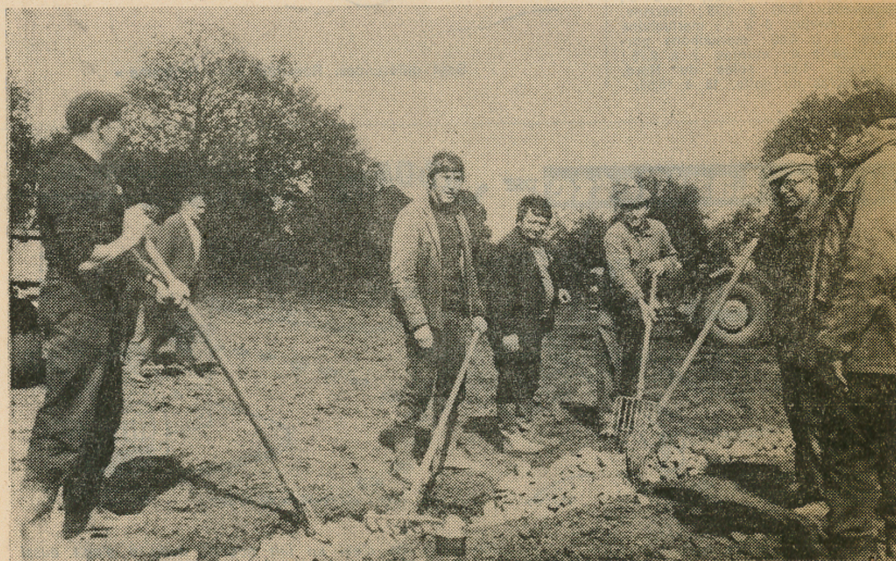
D'autres volontaires assurent le drainage

A Saint-Georges-de-Rouelley, l'union sportive, ce n'est pas un vain mot.